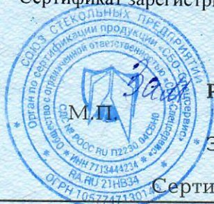
Схема сертификации: 2с

Сертификат зарегистрирован на сайте СДС № РОСС RU.П2230.04СБН0 www.sbosspr.ru